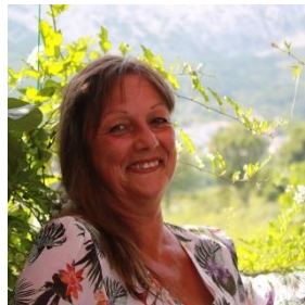
Véronique Hugo Three in One Concept®